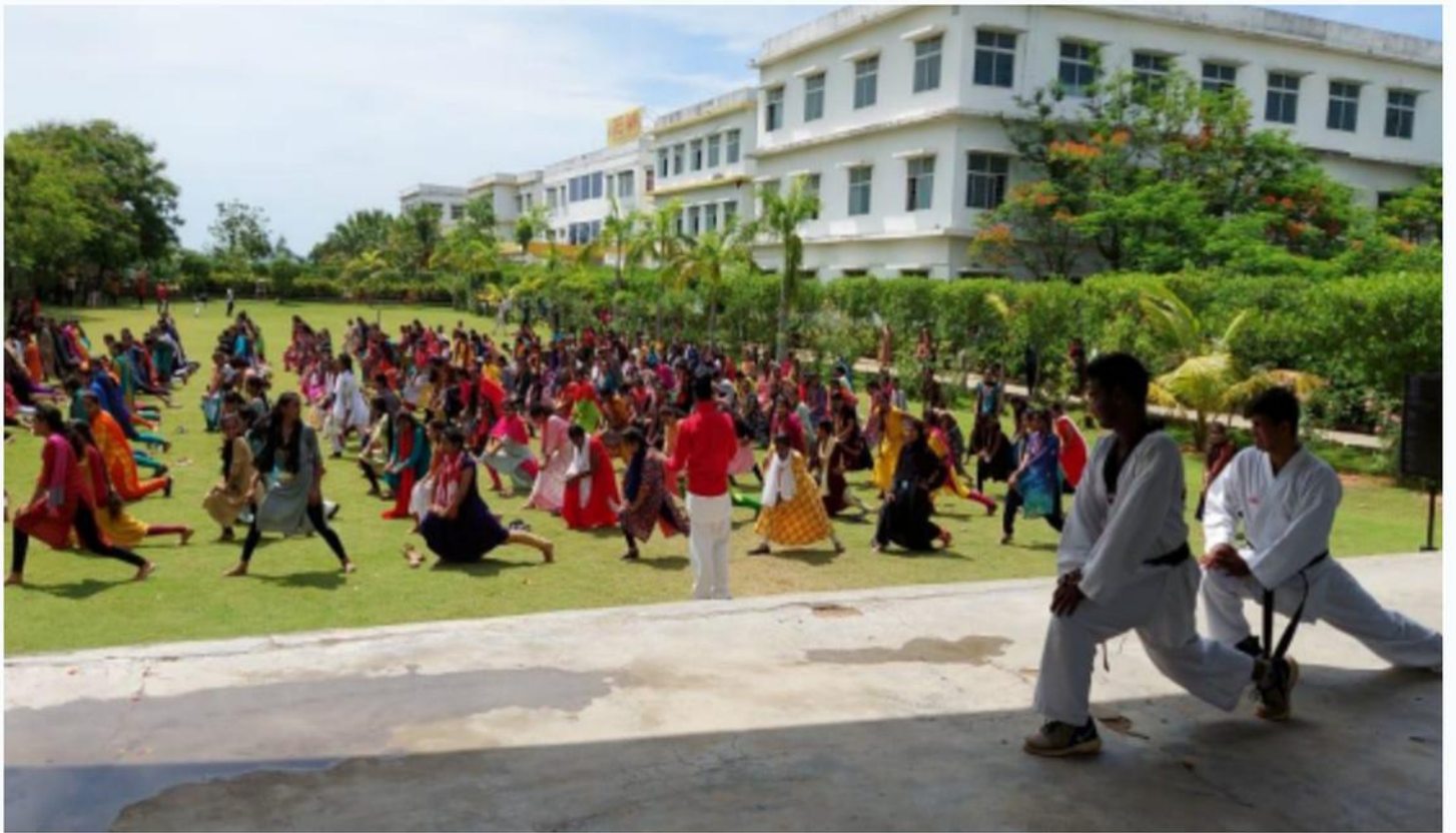
A one day workshop on Self Defence for Girl students on 13th June 2022

A one-day workshop on Self Defence for Girl Students was conducted on 13th June 2022 to empower them with essential techniques and confidence to handle challenging situations. The session included basic moves, hands-on practice, expert guidance, and real-life scenarios, fostering awareness, safety, and empowerment among participants.