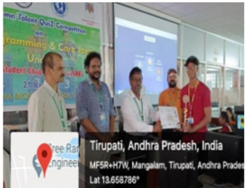
Prize distribution for Sree Rama Talent Quiz Competition on C-programming & Core Java

The Sree Rama Talent Quiz Competition on C-Programming and Core Java celebrated top performers, fostering a competitive spirit and enhancing technical skills, reflecting the college's commitment to academic excellence and student development.