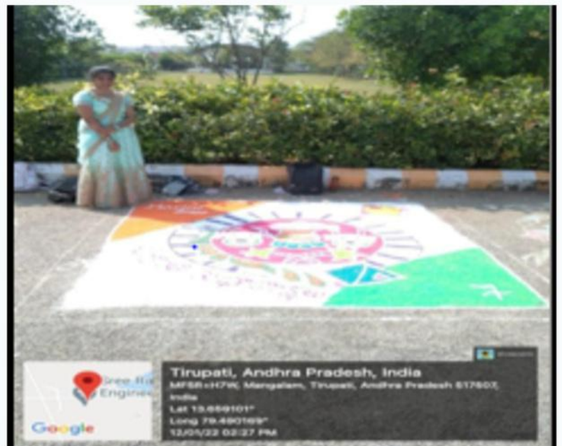
Rangoli Sajavo Desh ke naam ek rangoli sajavo in view of Azadi ka Amrutmahostav