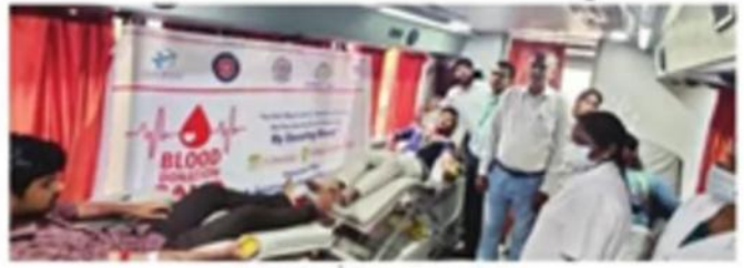
రక్తదానం చేస్తున్న విద్యార్థులు