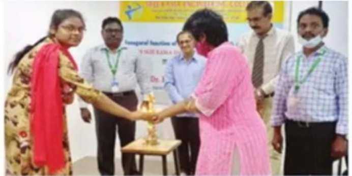
హోతి ప్రజ్వలన చేసి కార్యక్రమాన్ని ప్రారంభిస్తున్న శ్రీరామ ఇంజనీరింగ్ కళాశాల బృందం