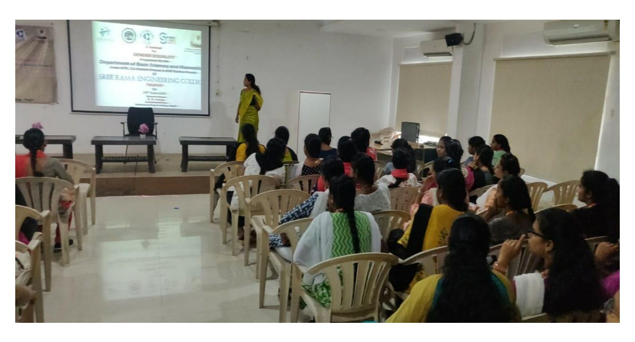
One seminar on Gender equity on 30<sup>th</sup> June 2022