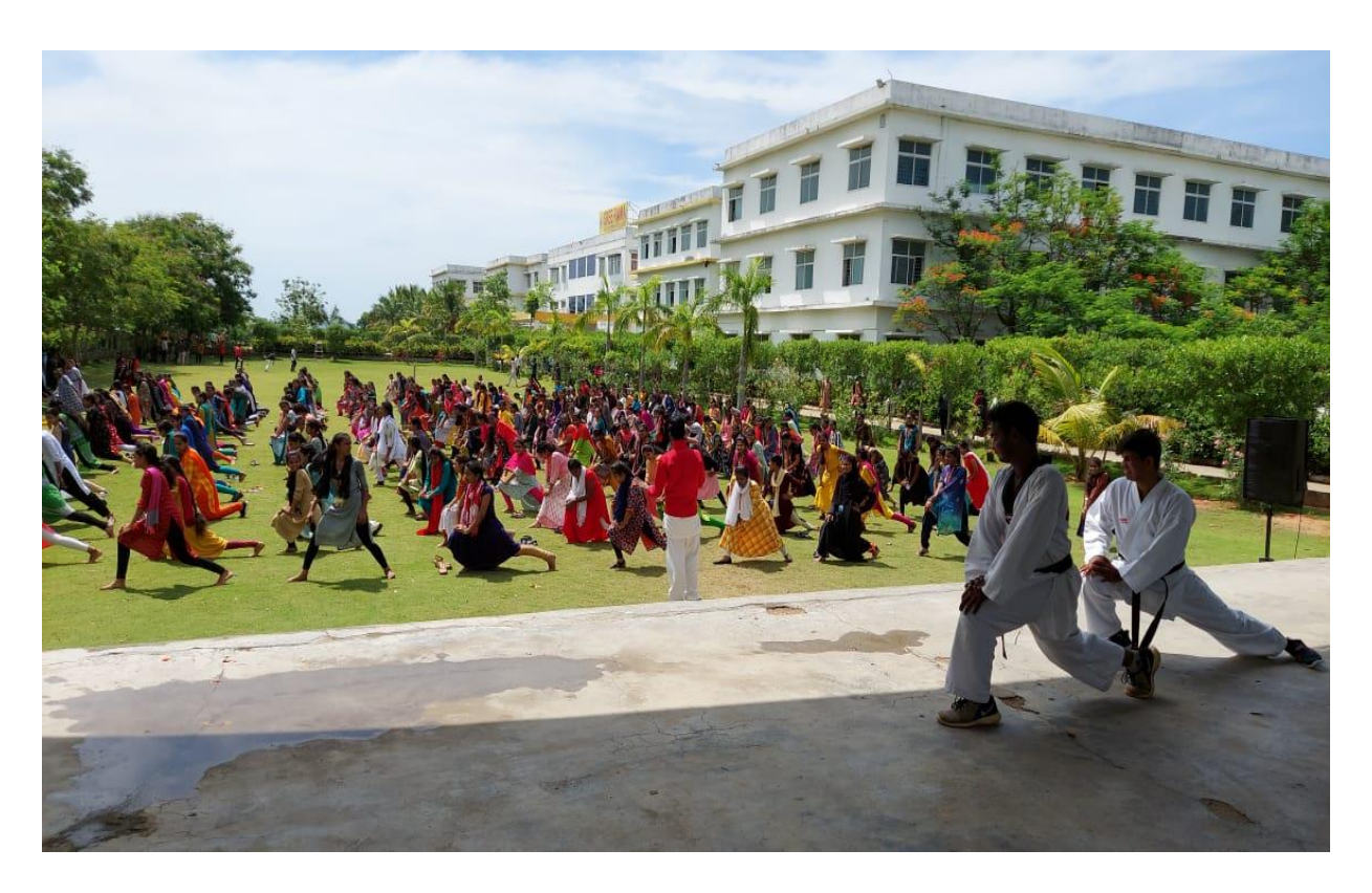
A one day workshop on Self Defence for Girl students on 13th June 2022